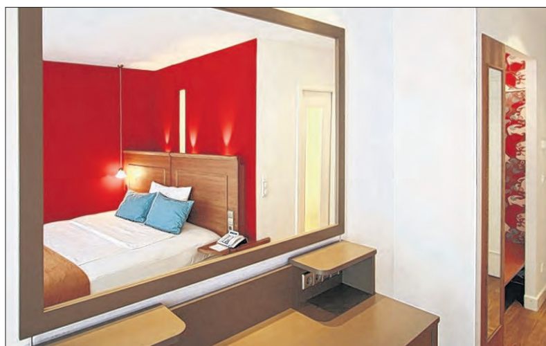
Der Einsatz von Spiegeln erzeugt Weite.

Bei allem Sinn für Ästhetik waren sich alle Beteiligten aber auch immer bewusst: Es muss bezahlbar sein. So fand der rund 550 000 Euro teure Umbau des gesamten Hotelkomplexes bei laufendem Gaststätten- und eingeschränktem Hotelbetrieb und in mehreren Etappen statt – eine organisatorische und fachliche Herausforderung, die von den ausführenden Handwerksbetrieben mit Bravour gemeistert wurde.