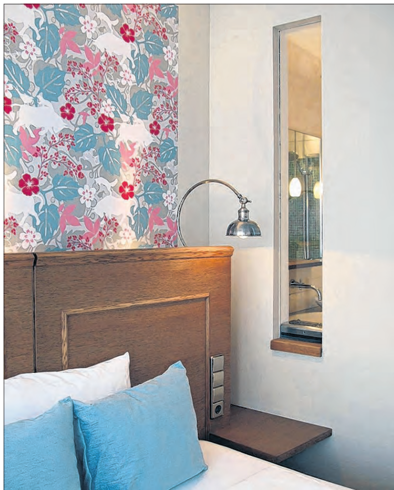
Wanddurchbrüche sorgen für ein besonderes Raumerlebnis.